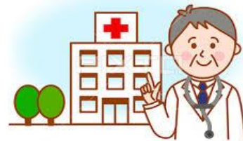
宇都宮リハビリテーション病院