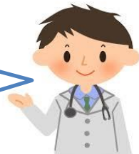
かかりつけ医 主治医