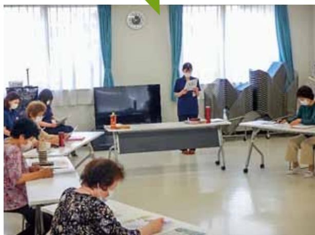
宇都宮中央生涯学習センター