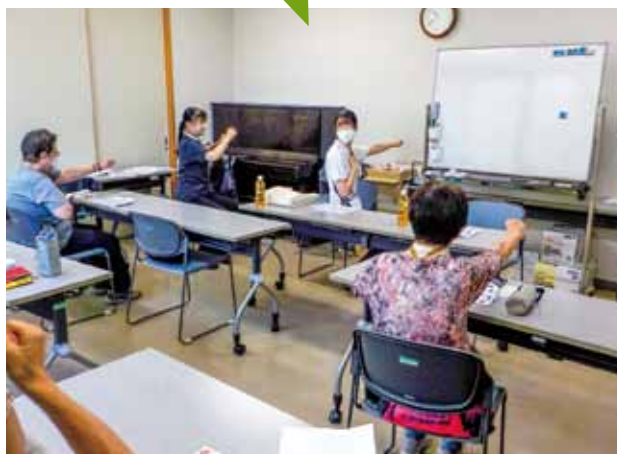
宇都宮西地域コミュニティセンター