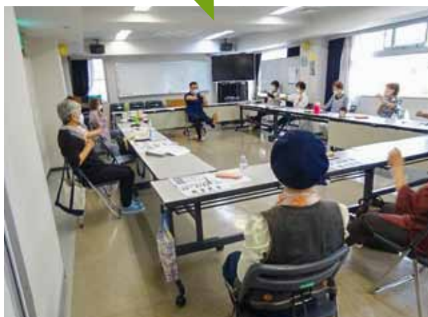
今里集落センター