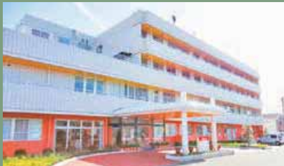
宇都宮リハビリテーション病院 栃木県宇都宮市御幸ヶ原町43-2 TEL.028-662-6789