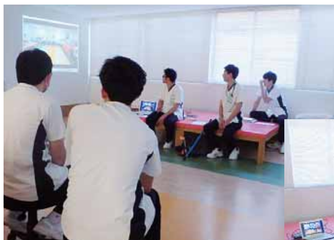
当院での装具検討会の様子