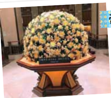
帝国ホテル・東京湾クルーズ